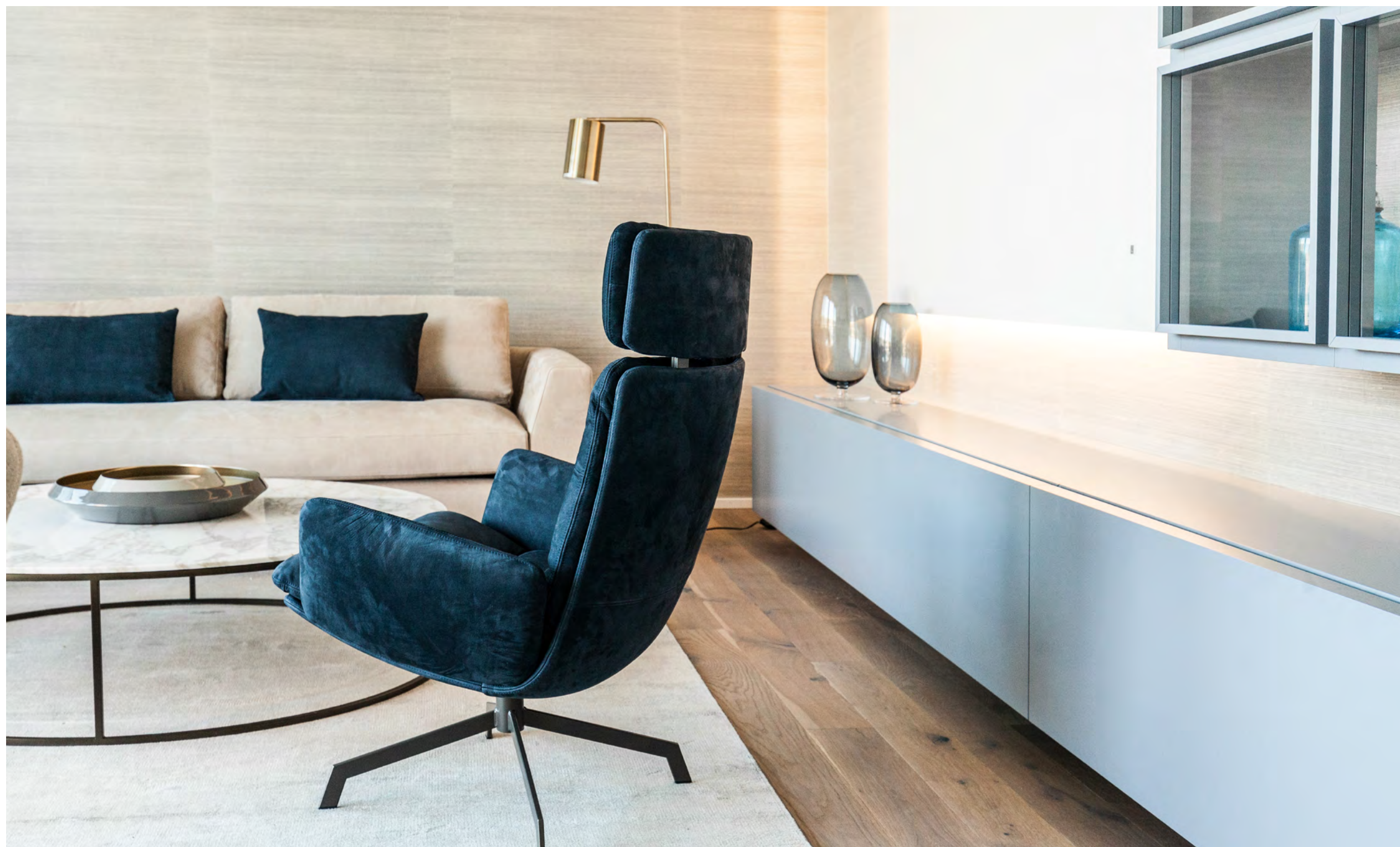
ARVA LOUNGE Sessel mit 4-Fuß-Stern-Gestell mit Wippmechanik