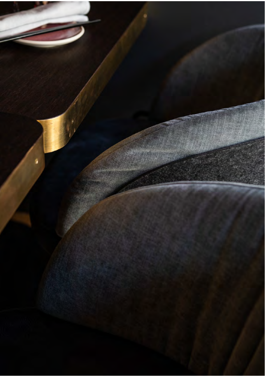
LUNAR PURE Stuhl mit 4-Fuß-Rundrohrgestell