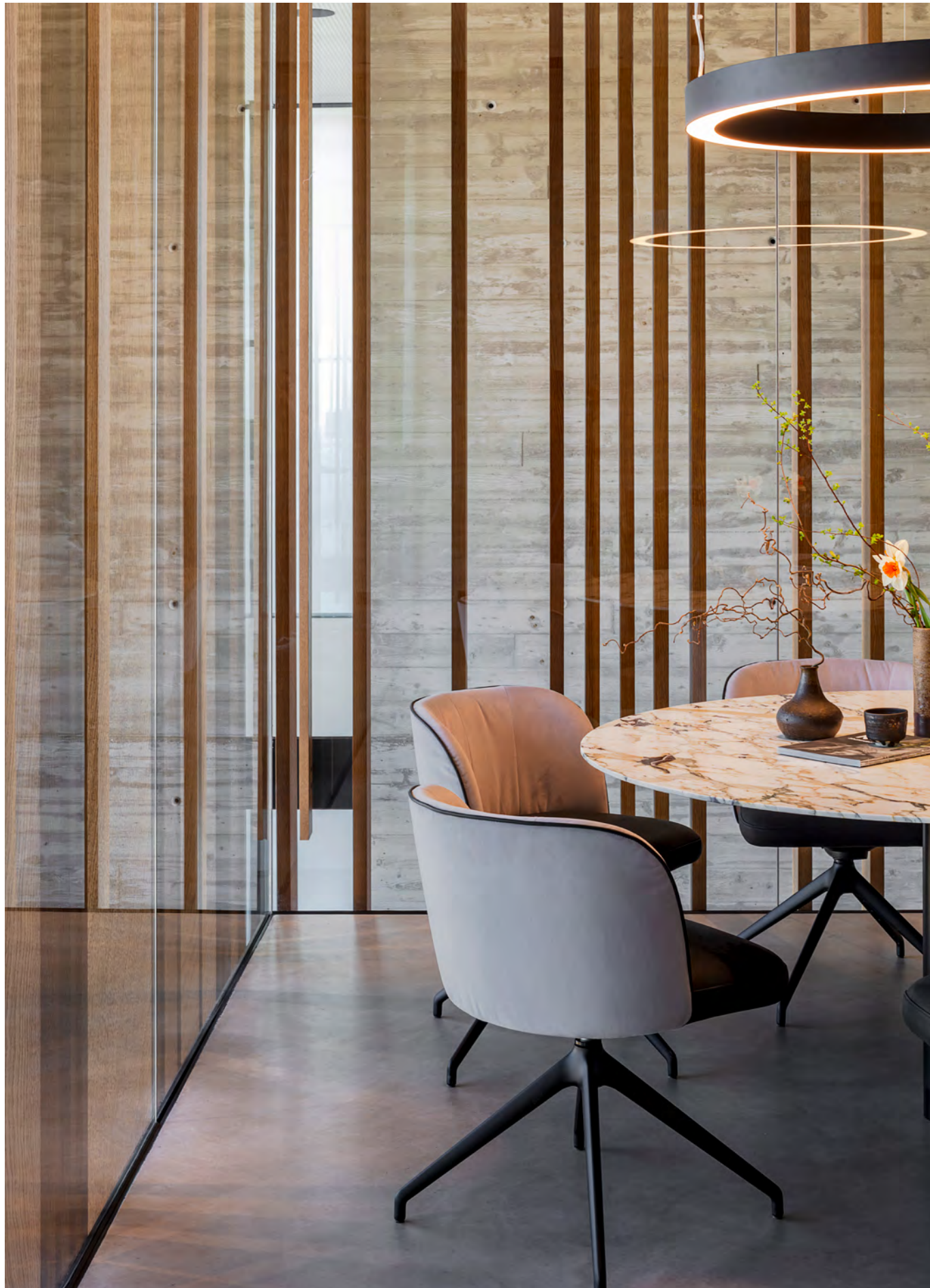
GAIA LINE Stuhl mit 4-Fuß-Stern-Gestell SL