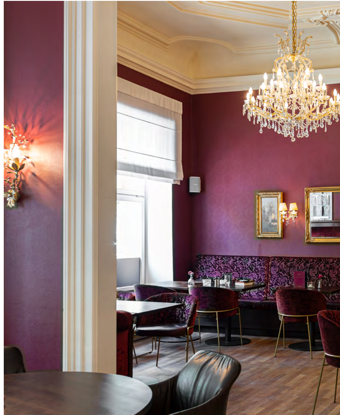
LUNAR LIGHT chair with 4-leg tubular steel frame