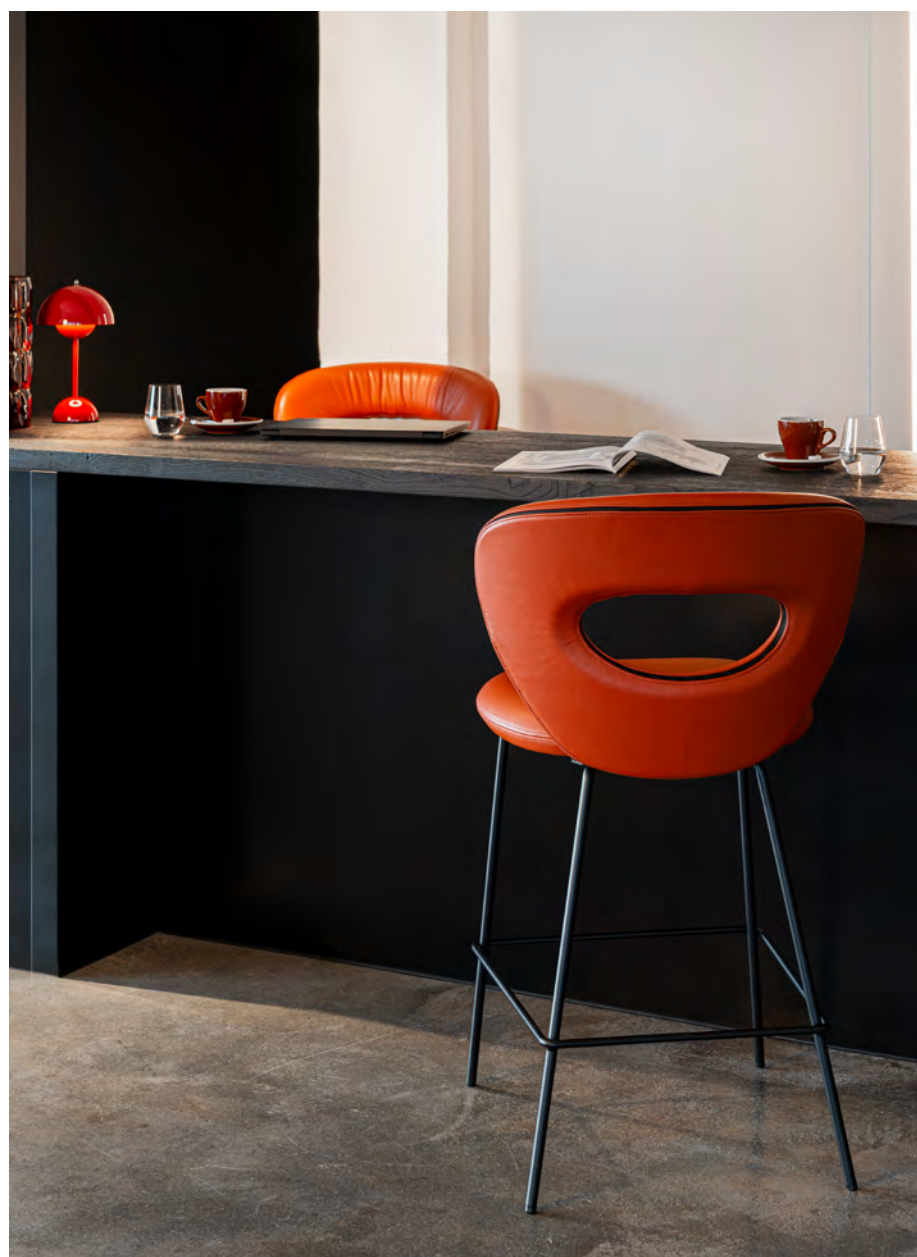
ALICE Thekenstuhl mit 4-Fuß-Rundrohrgestell