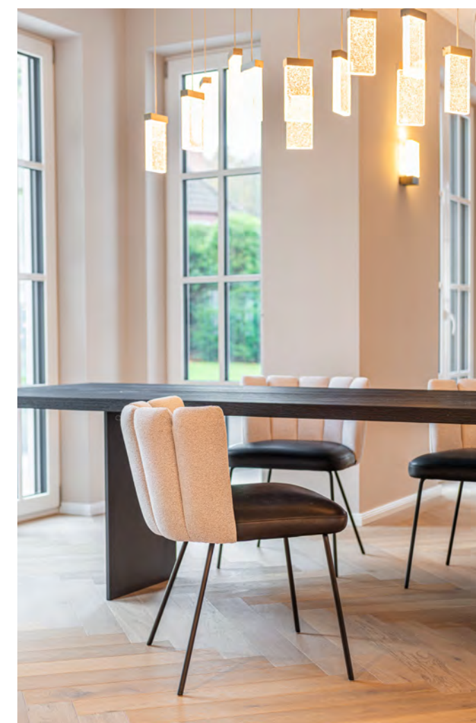
GAIA chair (5 back elements) with 4-leg tubular steel frame