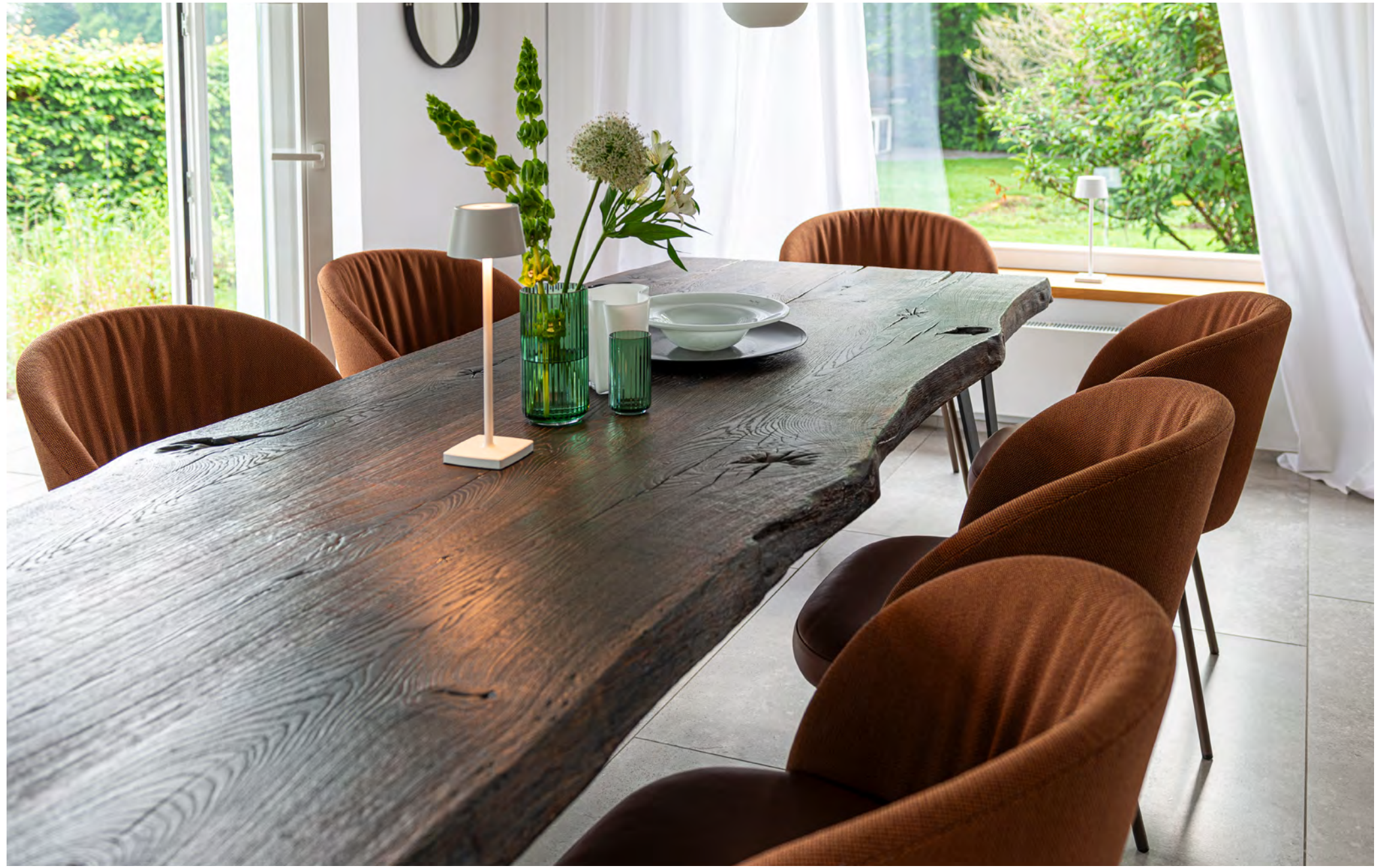
Nightingale table by ASCO RohDesign