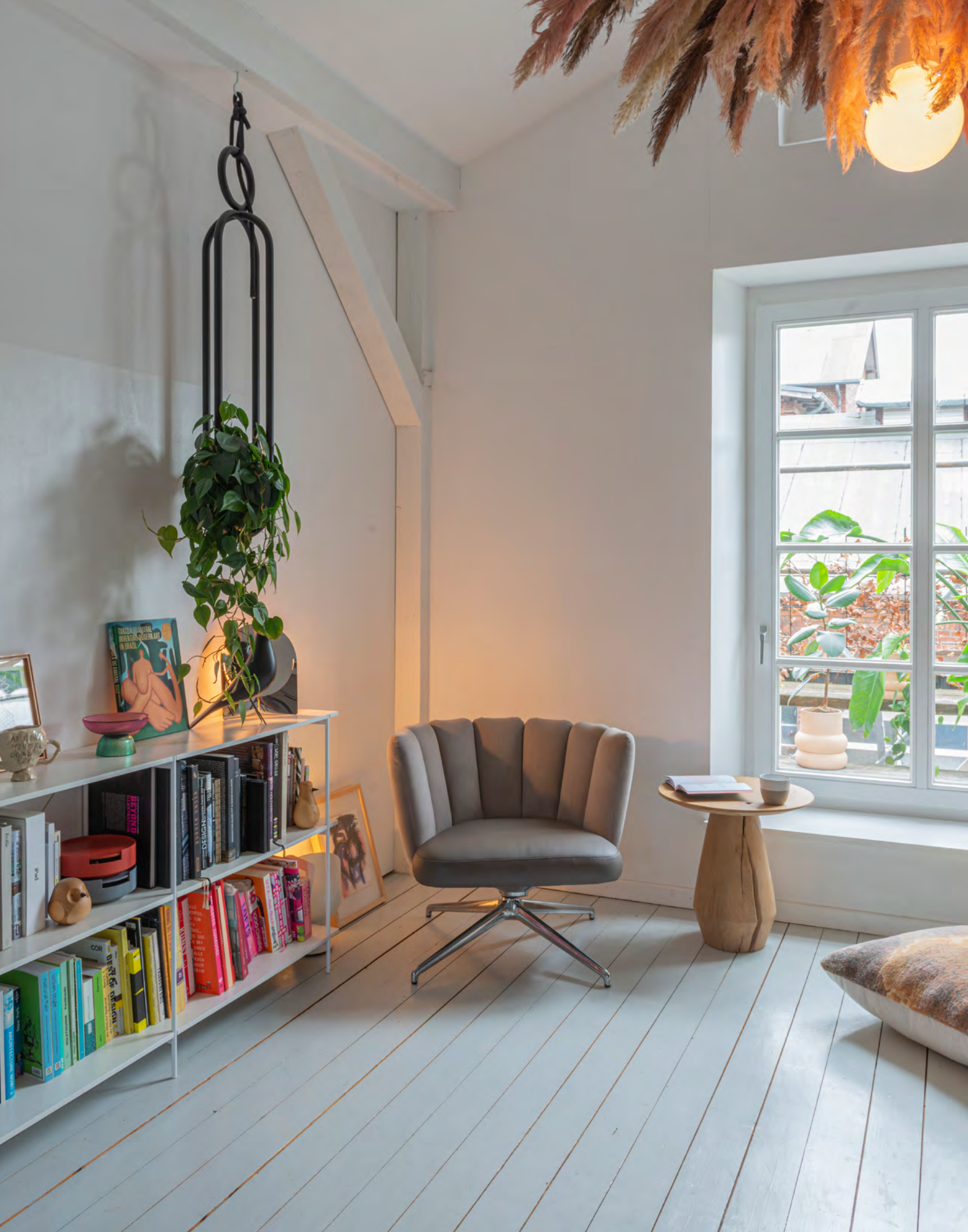
GAIA LOUNGE Sessel mit 4-Fuß-Stern-Gestell SL