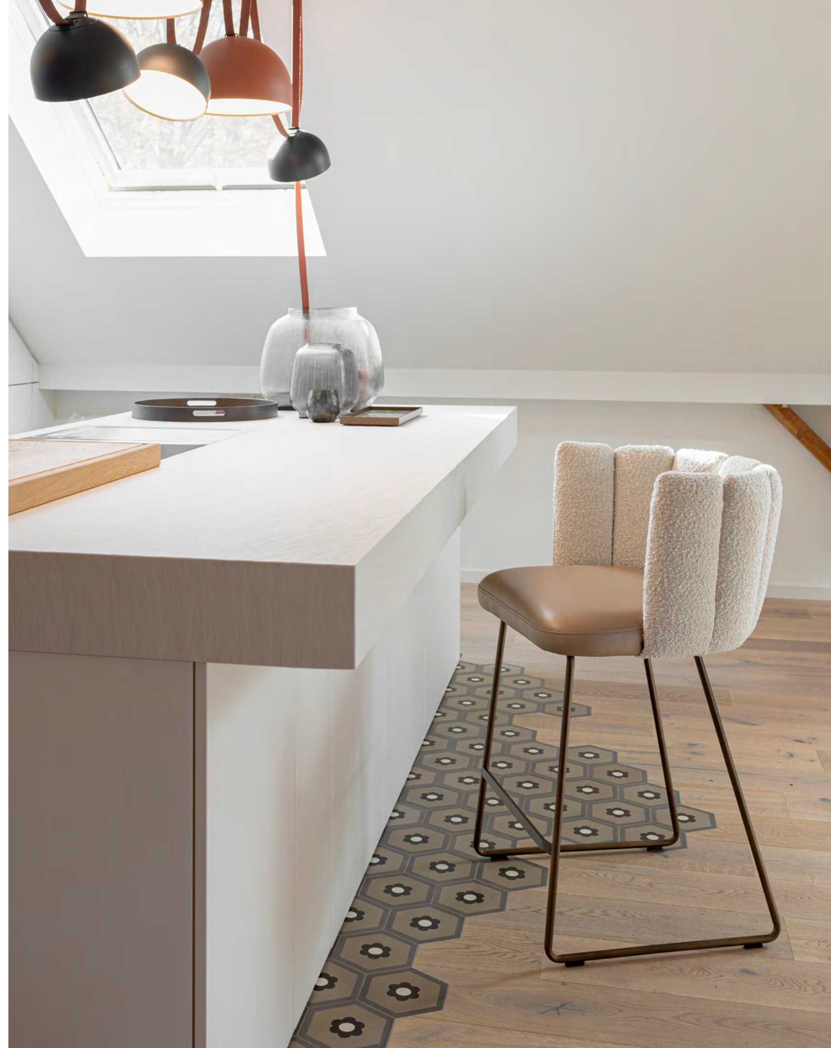
GAIA Thekenstuhl (7 Rückenelemente) mit Drahtkufengestell

EN The GAIA family comes from the pen of Italian designer Monica Armani. The separately upholstered flexible backrest elements and the sophisticated upholstery of the generous seat create the unmistakable look and impressive comfort of the GAIA family. In 2018, the first GAIA design was honoured with the German Design Award, followed by the award for the GAIA CALICE armchair in 2020. In 2024, the GAIA portfolio was expanded with the GAIA DIVANO sofa armchair. The Italian designer also designed the GAIA table compositions for KFF partner company ASCO. The table columns echo the upholstery fabric of the GAIA chairs, creating a harmonious and unique ensemble. GAIA - exquisite furniture in three seat heights for the home or the expressive object.