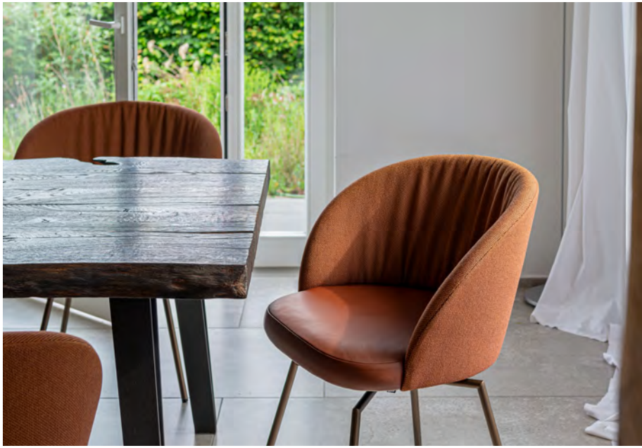
GIRO Stuhl mit 4-Fuß-Rundrohr-Kreuzgestell