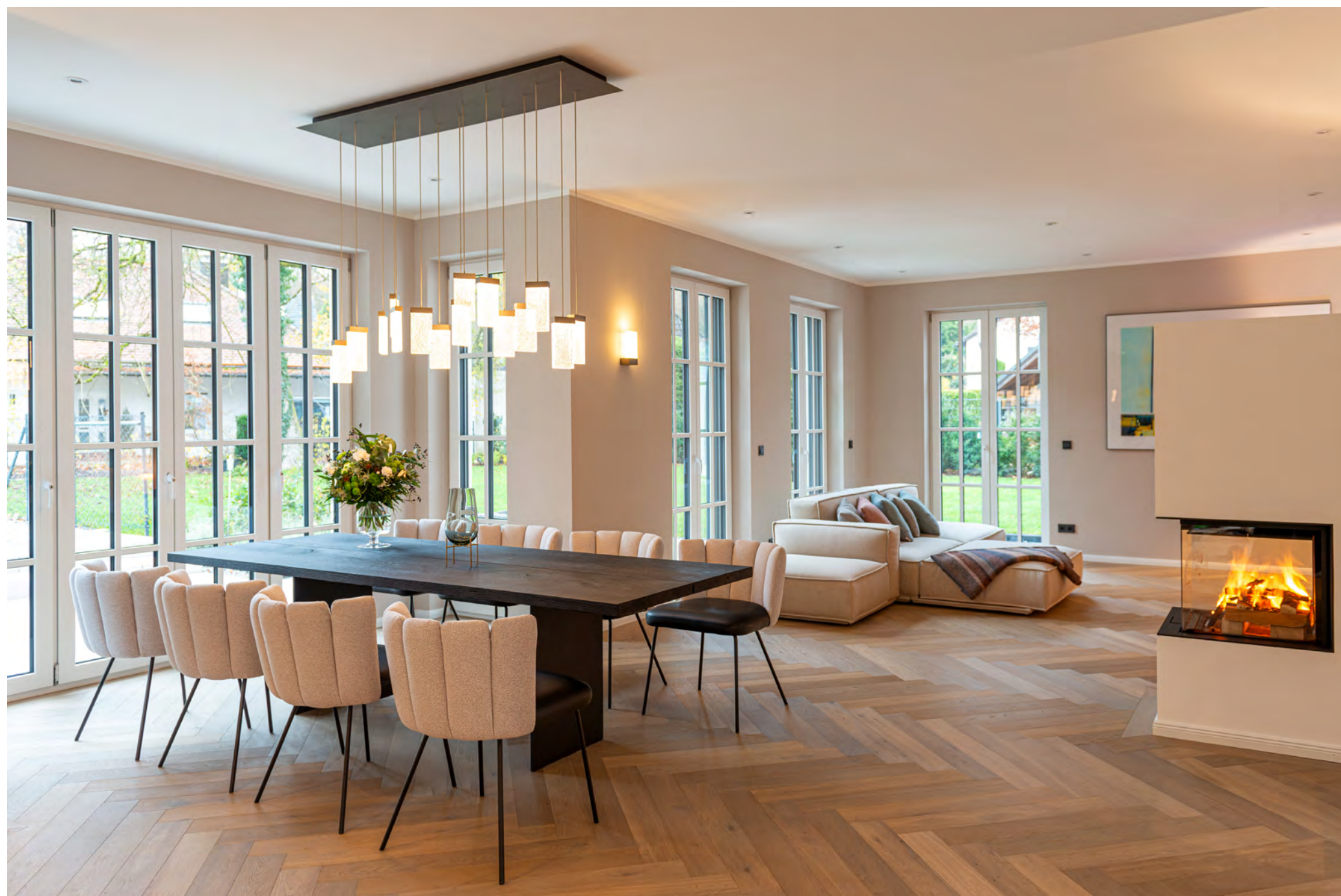
GAIA Stuhl (5 Rückenelemente) mit 4-Fuß-Rundrohrgestell