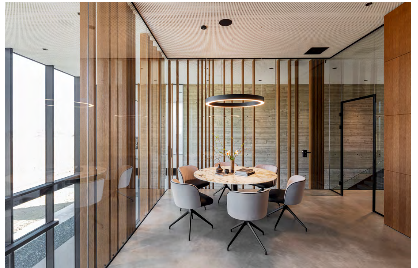
GAIA LINE chair with 4-leg star frame SL