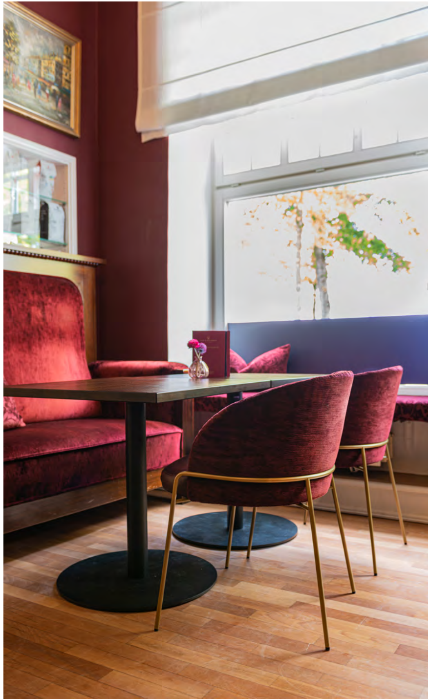
LUNAR LIGHT Stuhl mit 4-Fuß-Rundrohrgestell