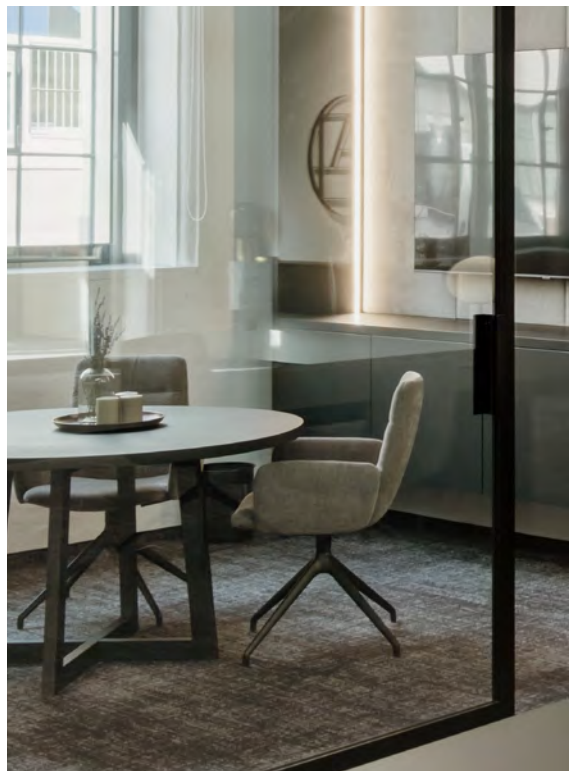
ARVA LIGHT Armlehnstuhl mit 4-Fuß-Stern-Gestell SL

ARVA LIGHT is the slim, directly upholstered version of the ARVA line in Mid Century design. The attractive seating furniture is ergonomically shaped, firm and upholstered to provide support in the back area. Thanks to the exceptional seating comfort and the light yet concise look, the ARVA LIGHT family is designed for innovative use. Beautifully shaped armrest and frame variations and the individual choice of coverings leave plenty of scope for personality. An appealing product family in three heights: Lounging, Dining and High Dining. Casual elegance for security and cosiness in the young private living area or in an unusual casual object.