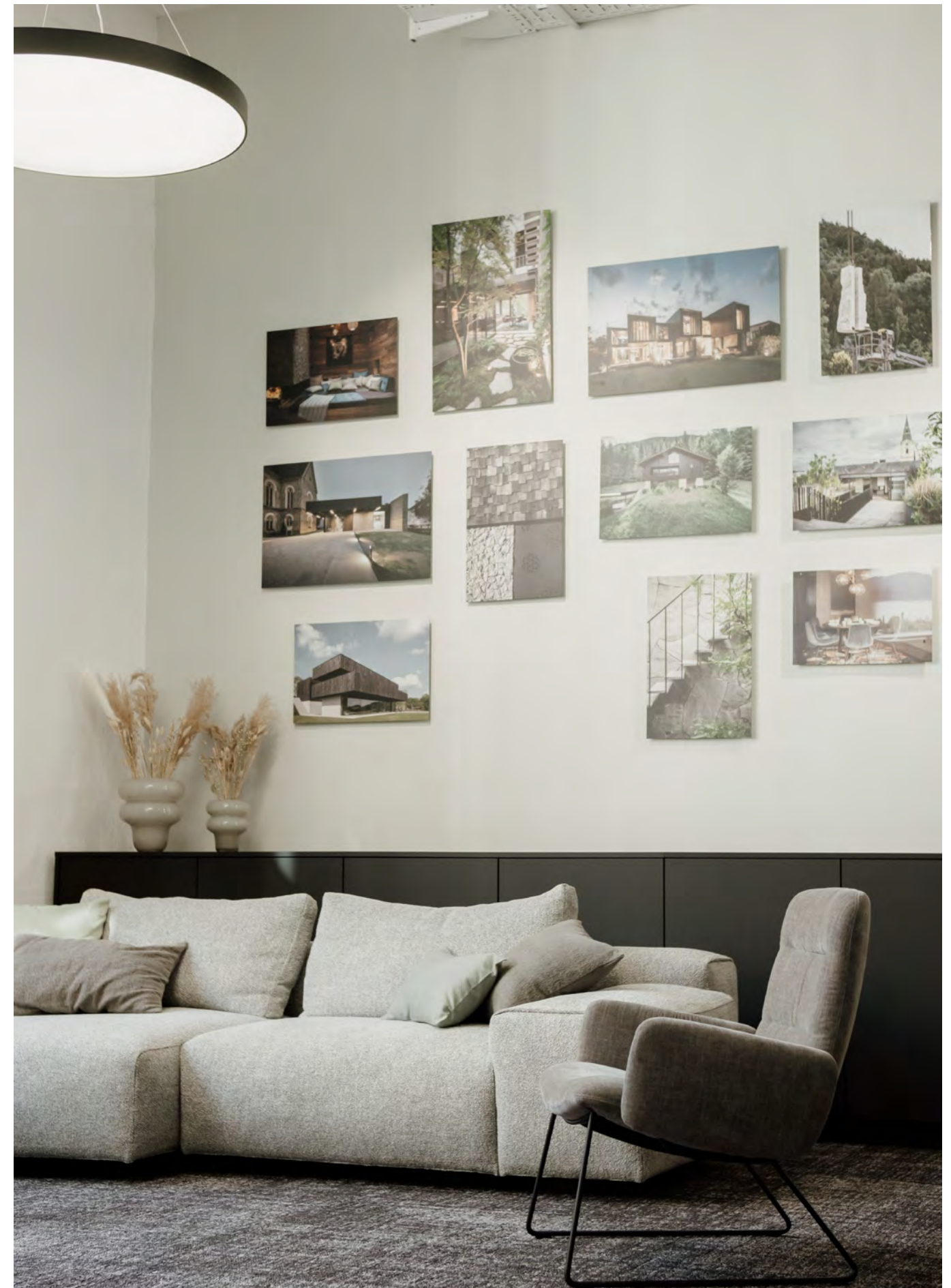
ARVA LIGHT LOUNGE easy chair with wire skid frame