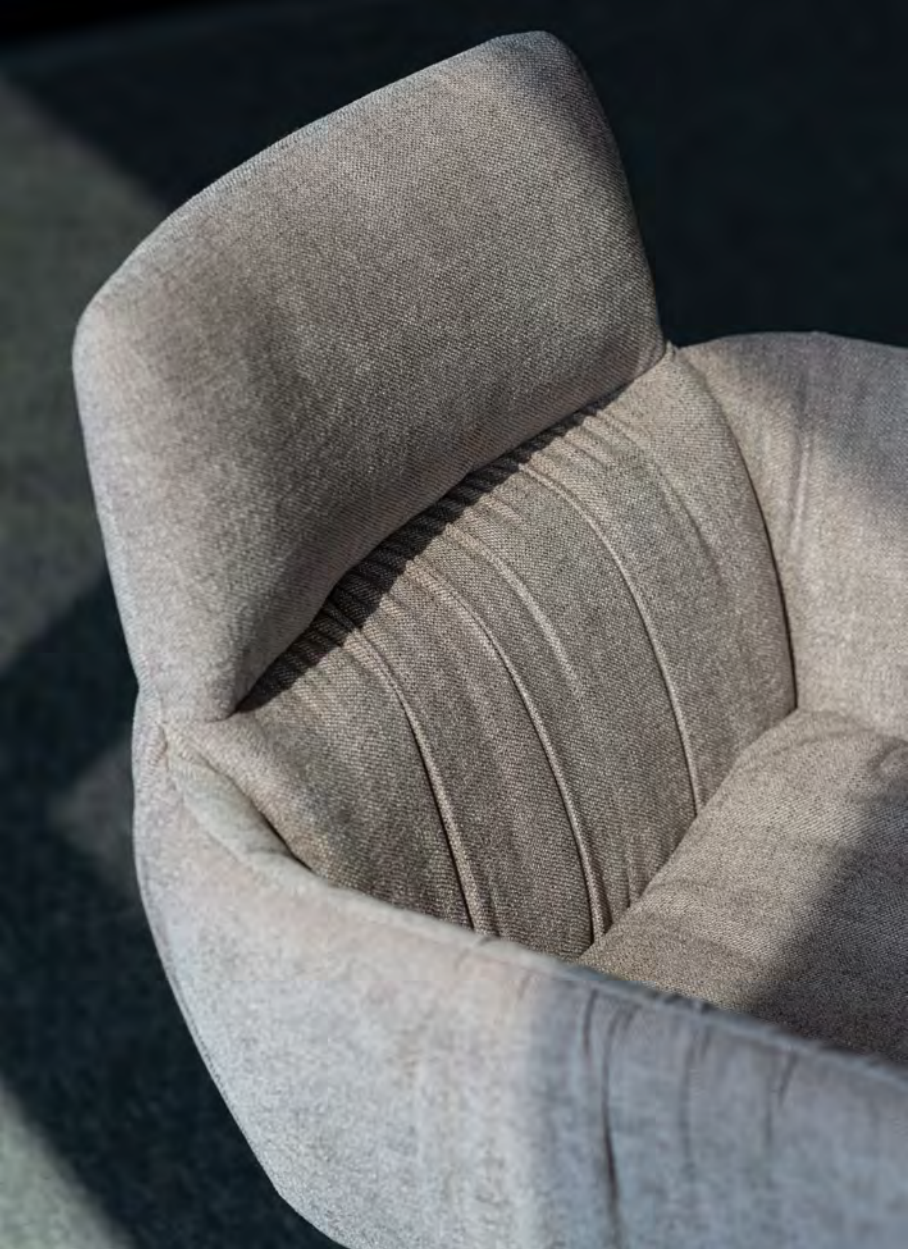
FAYE CASUAL Armlehnenstuhl mit 4-Fuß-Stern-Gestell SL