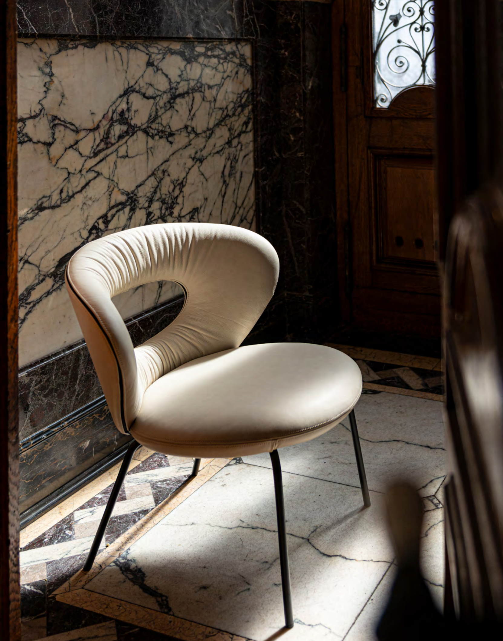
ALICE counter chair with 4-leg tubular steel frame