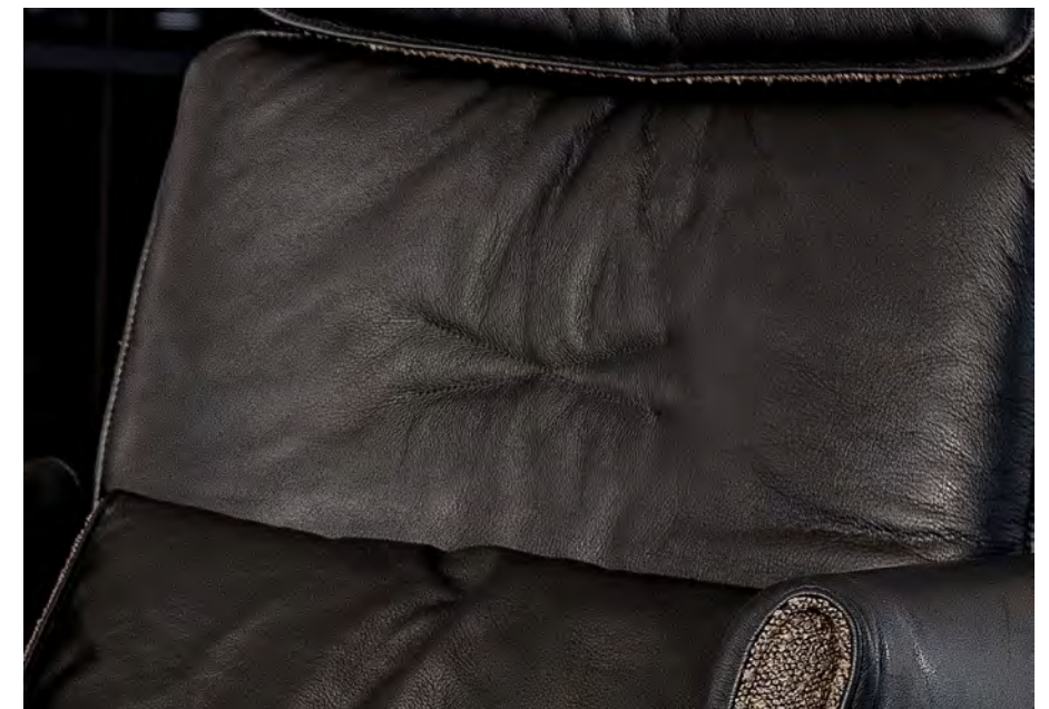
CADO LOUNGE Sessel und Ottomane auf Säulengestell mit runder Bodenplatte